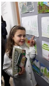
Mavric Nadija I 3