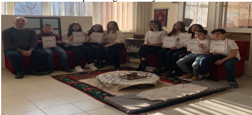
Takmirači sa osvojenim diplomama