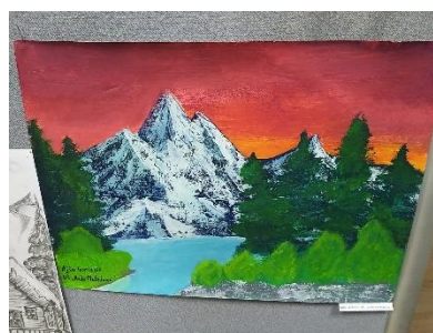
Gorčević Ajša VIII 3