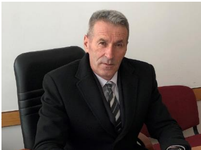
direktor od 3. 4. 2020. godine