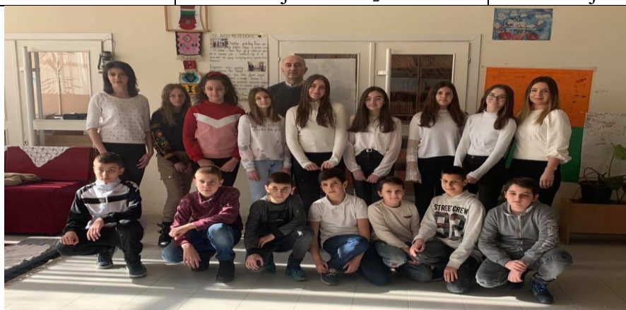
Učesnici opštinskog takmičenja iz matematike